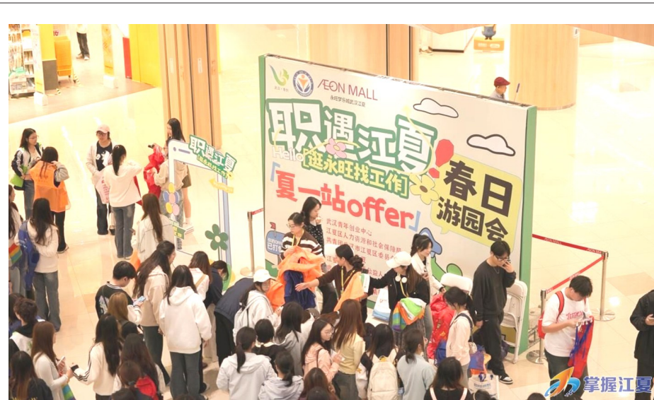
3月29日，永旺梦乐城举办“职遇江夏 逛永旺找工作”春日游园会。活动打破传统招聘模式，将60余家企业、800余个岗位引入商圈，融合政策咨询、青春市集、游园打卡等特色服务，实现“逛街求职两不误”。现场还设置直播带岗、简历打印、证件照拍摄等暖心服务，累计投递意向500余份，市集摊位销售5000余元，为青年就业创业提供一站式支持。

现场，山坡街道代表向一批长期资助助学、帮扶济困的爱心企业颁发了锦旗，表达敬意与感谢。部分用人单位代表分别介绍了企业发展、项目推进及供需合作需求。山坡卫生院负责人介绍了卫生院项目进展及现场义诊服务情况。中国中铁七局集团武汉工程有限公司与武汉拓泽贸易有限公司作为企业代表进行了现场签约。