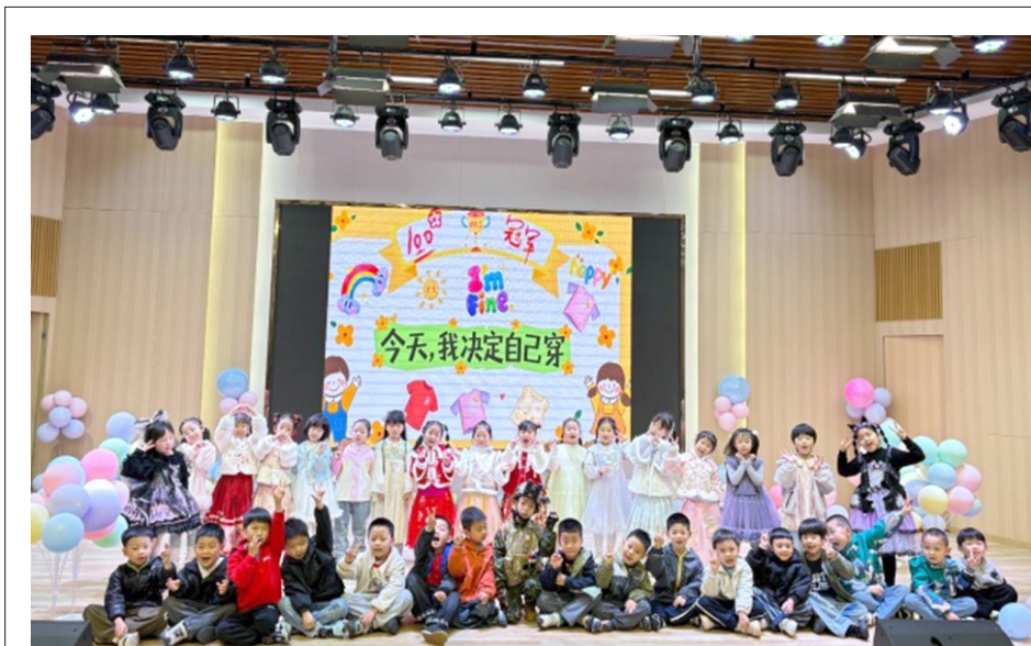
近日,区中心幼儿园开展了“穿衣自由日”主题活动。活动当天,小警察、小公主、国风汉服等各式穿搭亮相,孩子们自主选衣、大胆展示,在轻松氛围中感受美、表达美、欣赏美,收获自信与成长。图为孩子们穿着自选衣服集中展示。

江夏融媒讯(记者 夏融)近日,教育部办公厅印发《关于公布2025年全国青少年校园足球特色学校名单的通知》(教体艺厅函〔2026〕13号),全国共有4928所学校获此殊荣,其中武汉市有14所学校入选,江夏区文化大道小学榜上有名,为我区校园足球发展再添新亮点。 据悉,文化大道小学创办于2021年9月,秉持“以文化人,行道致远”的校训,深耕校园足球特色建设,不仅将足球纳入体育课程体系,还于2023年9月成功举办首届“校长杯”校园足球联赛,累计开展赛事30场,评选出冠亚军及各类单项奖项,营造了浓厚的校园足球氛围,不仅丰富了学生课余生活,更培育了学生团结协作、顽强拼搏的体育精神。 截至目前,我区累计已有14所全国青少年校园足球特色学校,校园足球发展成果显著。