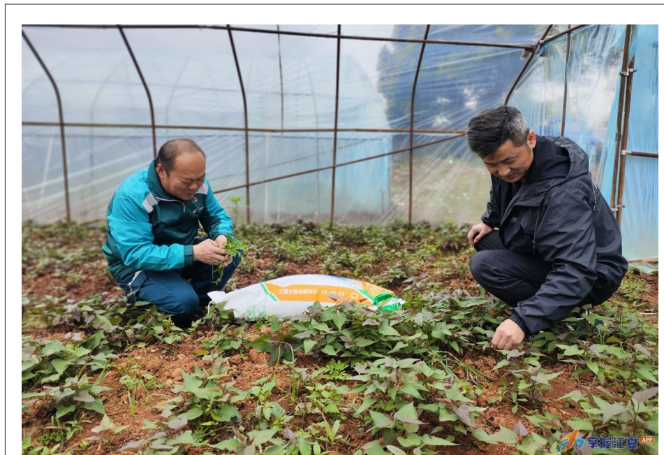
近日，舒安街桂林志愿者服务队满载5吨春耕肥料，深入田间地头，为农户送肥、送技、送政策。舒安街农业服务中心志愿者化身“田间教员”，手把手指导施肥、防虫害，并现场讲解农机补贴政策。自3月1日以来，队员们穿梭于舒安街20个村湾，已累计为35户农户送去春耕肥110吨。18年来，这支队伍始终奔走在村湾之间，将春耕服务送到田埂上。

朱宜排展望，企业落地后将分三步推进：首先整合部门与产线，提升运营效率；其次打造智能工厂，推动生产数字化与AI应用；最后深化产学研合作，加速新品研发，拓展院线与电商渠道。（来源：长江日报）