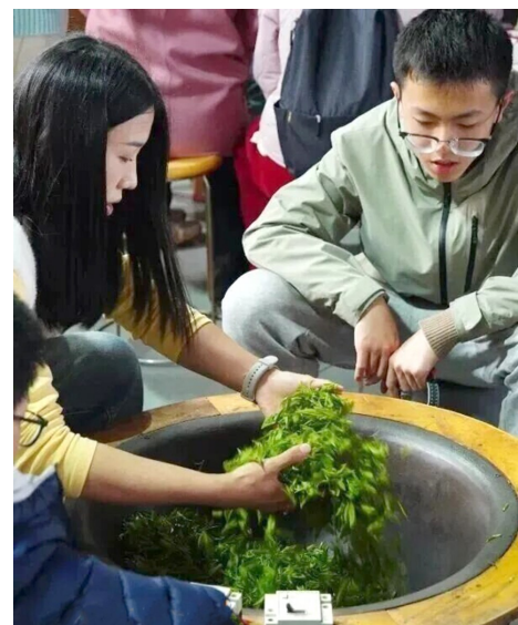
近期，江夏见山光明茶旅民宿集群迎来采茶制茶旺季。各类非遗研学产品热度攀升，吸引了众多亲子家庭走进茶园，在传承人指导下亲历“一芽一叶”采摘与手工制茶全流程。活动将采茶、制茶、品茶与餐饮交通等多元服务有机整合，既激活了乡村茶旅资源，也为光明茶开辟了体验经济的新路径。一片绿叶，串联起非遗活化、亲子消费与乡村增收的良性循环。

截至目前，全区已免疫猪口蹄疫44.5万头、猪瘟44.5万头、禽流感319.76万羽、牛口蹄疫0.03万头、羊口蹄疫0.03万头、羊小反刍兽疫0.03万头。整个春防计划于4月底全面完成。