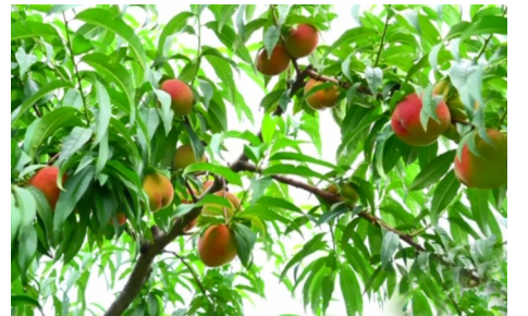
盛夏时节,湖泗街270亩桃园喜获丰收。祝祠村127亩桃林里,血桃、黄桃、水蜜桃挂满枝头,果农正加紧采摘,供应持续至6月底。浮山村40余亩有机桃以清甜口感走俏市场。同时,新安村引进的黄桃新品种预计2028年大规模上市,为“甜蜜经济”持续注入活力。

目前,项目前期工作已基本完成,具备全面开工条件。项目建成后,武汉绕城高速南环将全面升级为双向八车道快速通道,增强武鄂黄黄核心区路网韧性,为武汉都市圈交通一体化发展注入新动能。