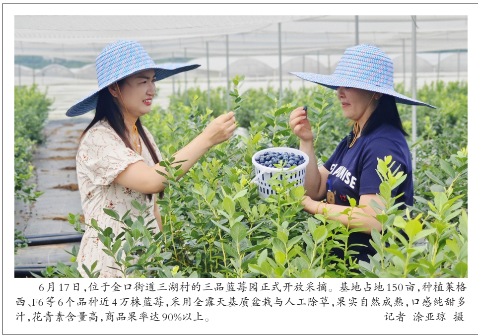
6月17日,位于金口街道三湖村的三品蓝莓园正式开放采摘。基地占地150亩,种植莱格西、F6等6个品种近4万株蓝莓,采用全露天基质盆栽与人工除草,果实自然成熟,口感纯甜多汁,花青素含量高,商品果率达90%以上。

近年来,乌龙泉街把土地堂西瓜作为江夏农业品牌重点产业来打造,坚定不移做大规模、提升品质。这次推介活动走进江夏市民之家,旨在扩大本土优质农产品在企业和群众中的影响力和知名度,进一步激发我区农村特色产业活力,助力乡村振兴。